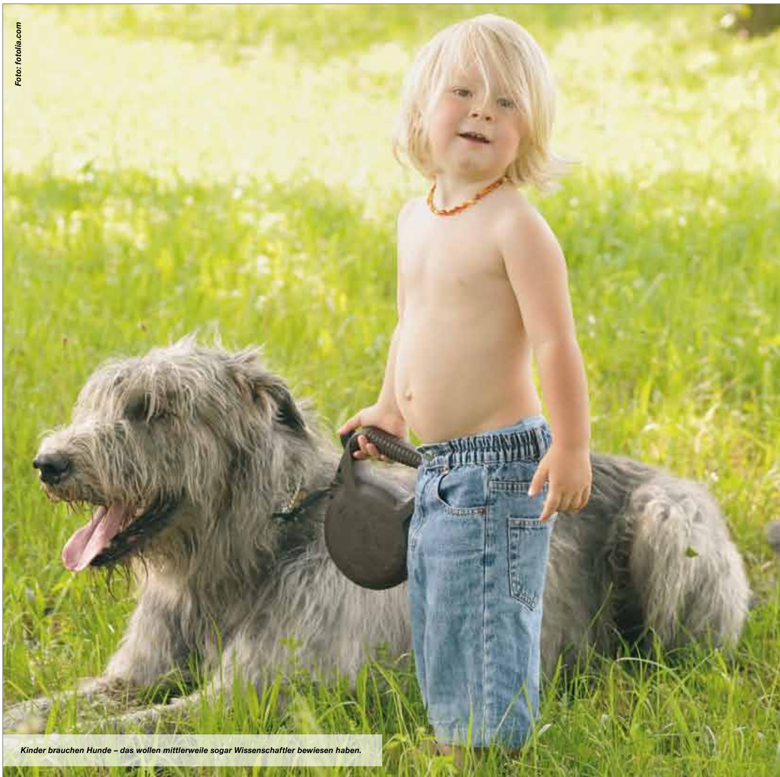
Kinder brauchen Hunde – das wollen mittlerweile sogar Wissenschaftler bewiesen haben.