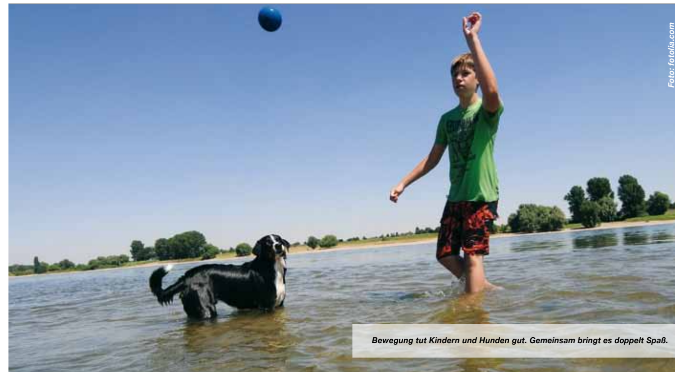
Bewegung tut Kindern und Hunden gut. Gemeinsam bringt es doppelt Spaß.